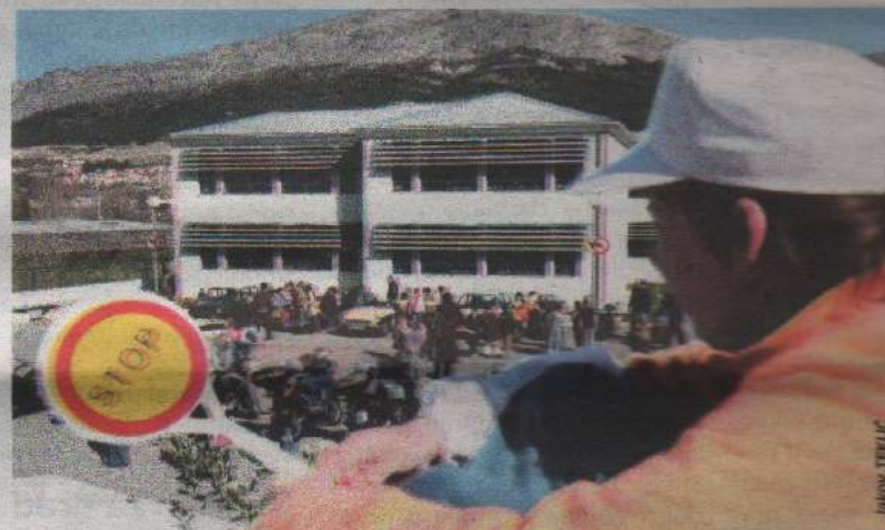
Učenici Osnovne škole kraljice Jelene sudjelovali su krajem ožujka u projektu Dan sigurnosti u prometu