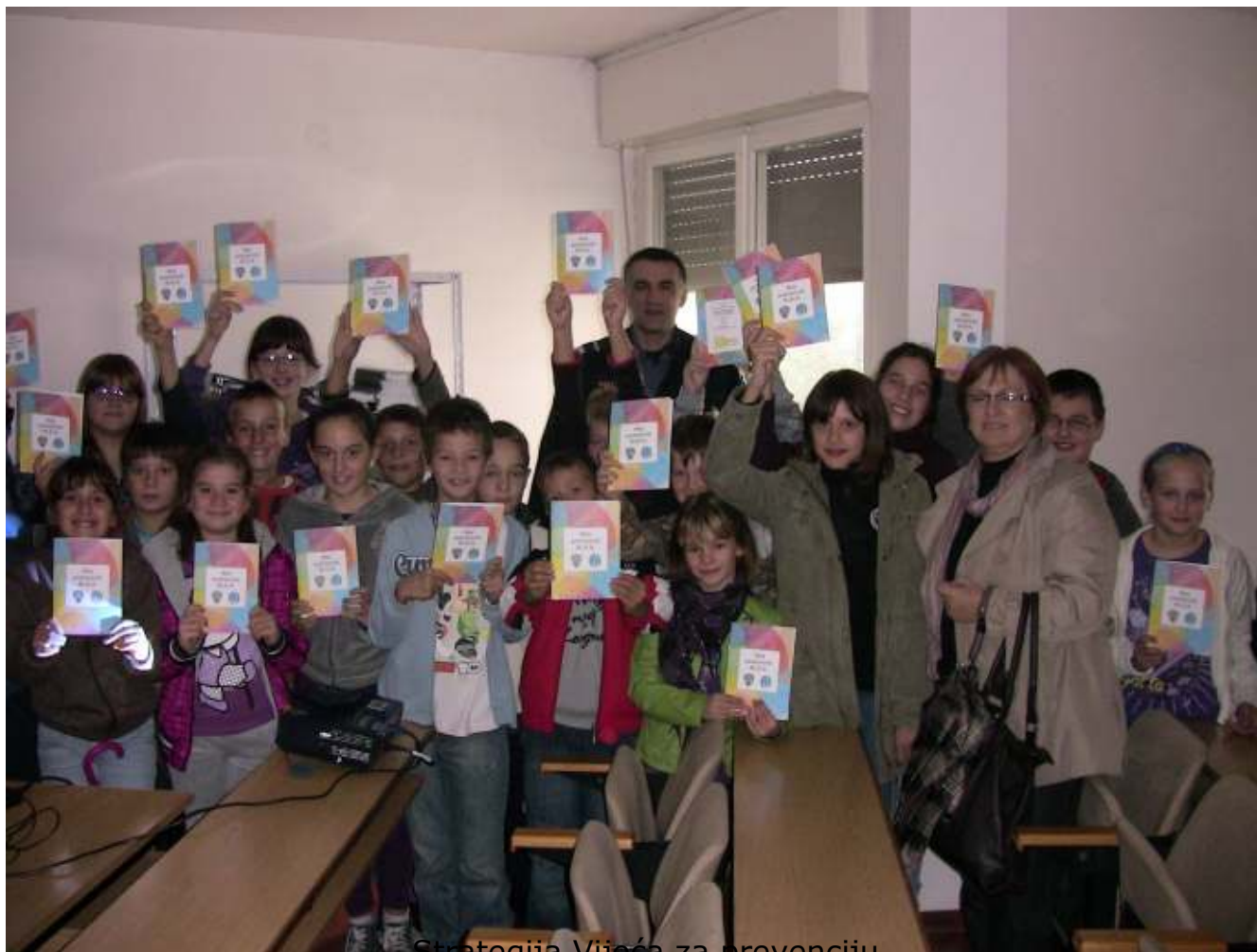
Strategija Vijeća za prevenciju 2012. - 2014.