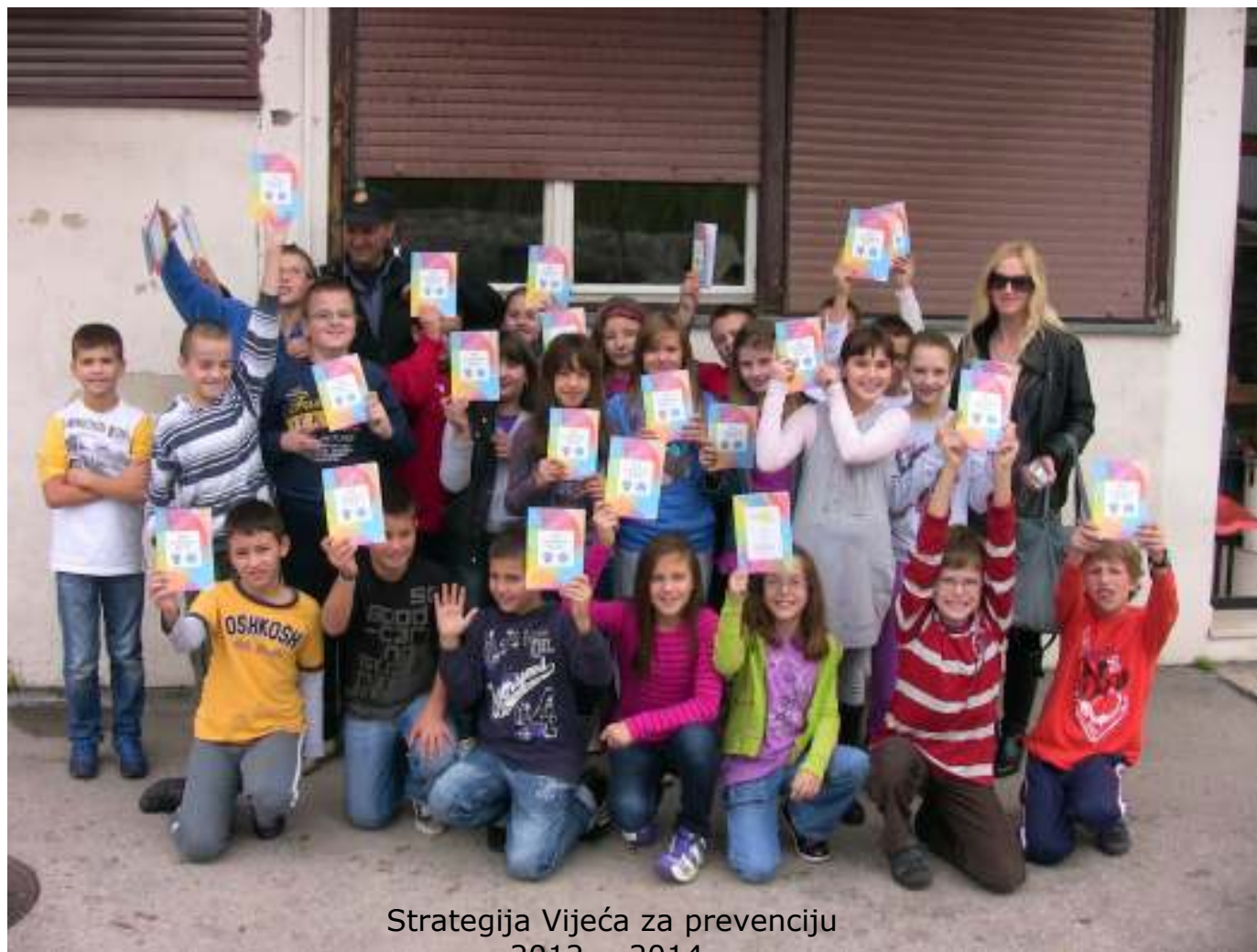
Strategija Vijeća za prevenciju 2012. - 2014.