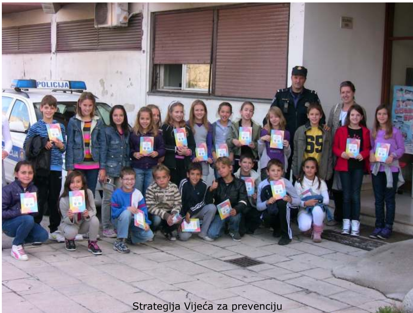
Strategija Vijeća za prevenciju 2012. - 2014.