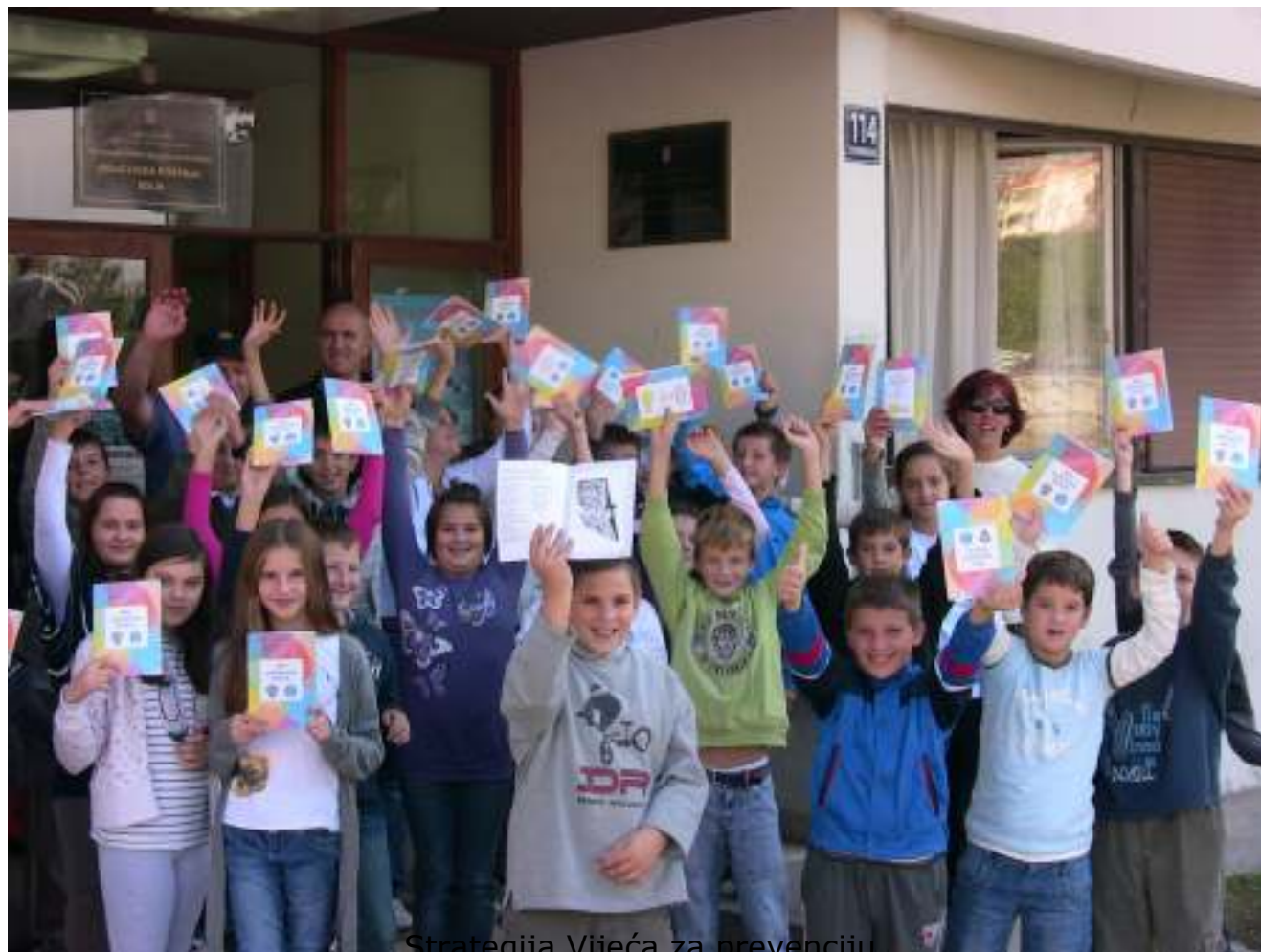
Strategija Vijeća za prevenciju 2012. - 2014.