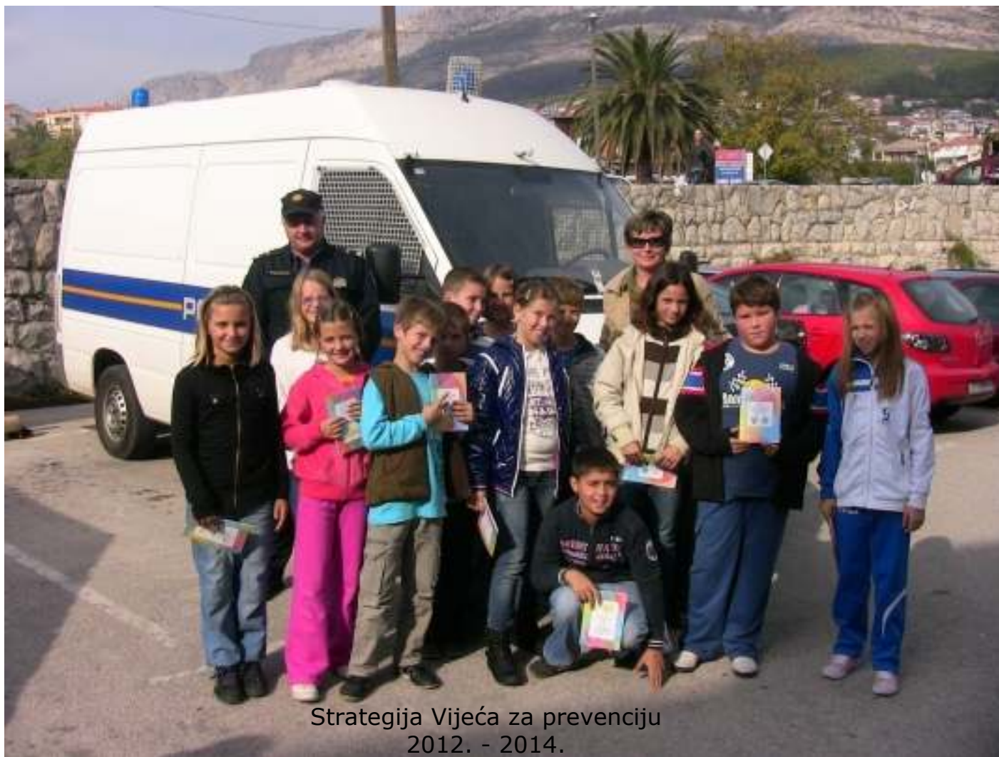
Strategija Vijeća za prevenciju 2012. - 2014.