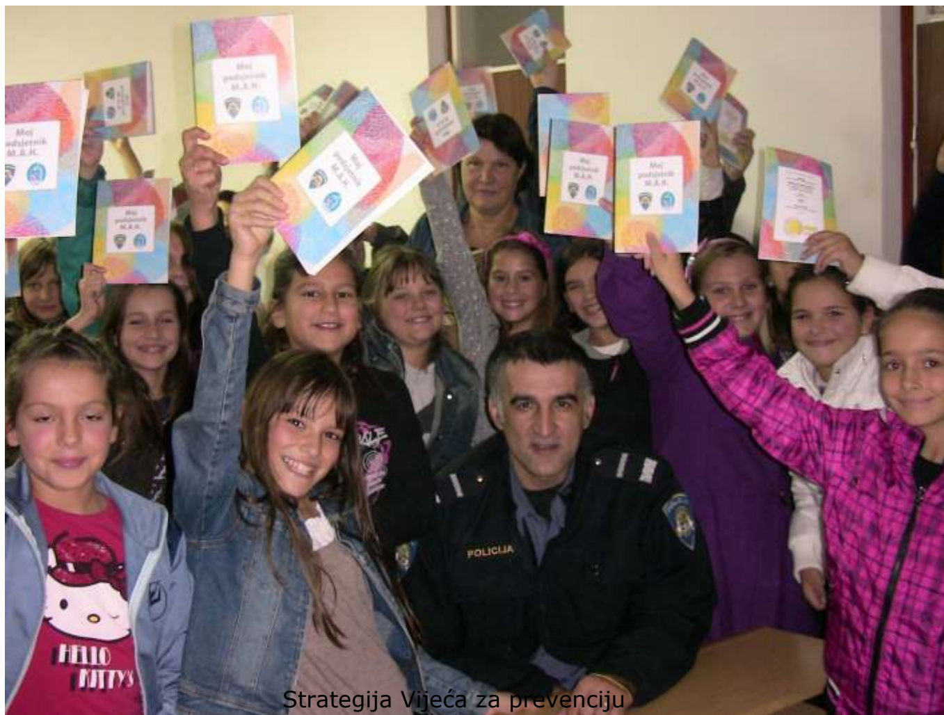
Strategija Vijeća za prevenciju 2012. - 2014.