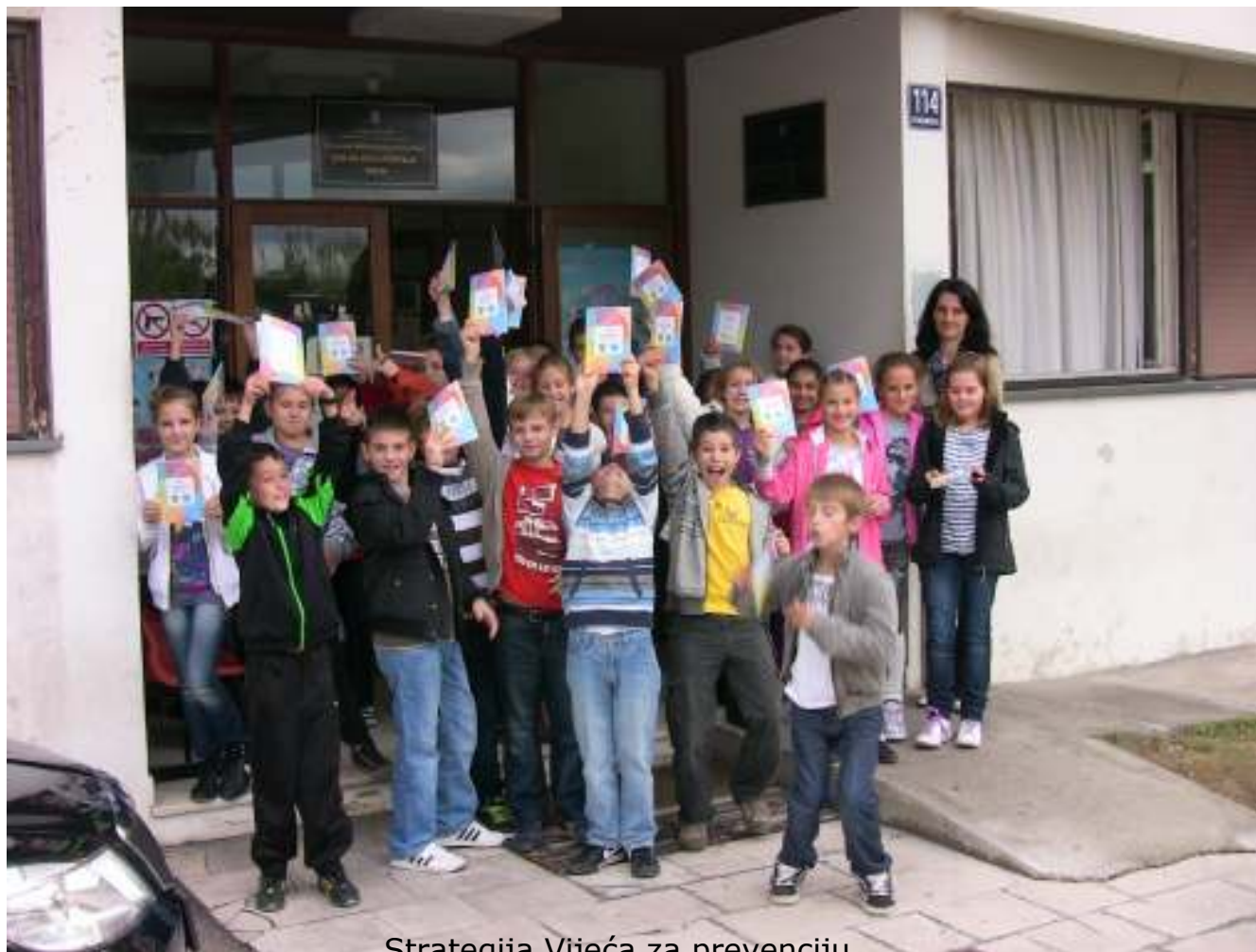
Strategija Vijeća za prevenciju 2012. - 2014.